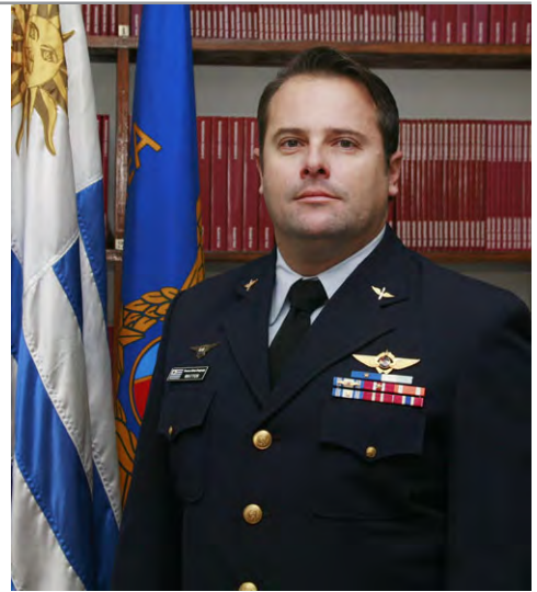
Cnel. (Av.) Gustavo Mattos

Sean bienvenidos a la Escuela de Comando y Estado Mayor Aéreo.